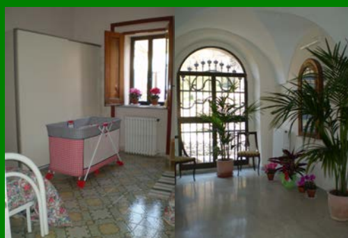
Centro di Arpaia (Bn)