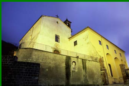
Centro di Arpaia (Bn)